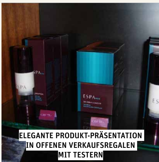
ELEGANTE PRODUKT-PRÄSENTATION IN OFFENEN VERKAUFSREGALEN MIT TESTERN