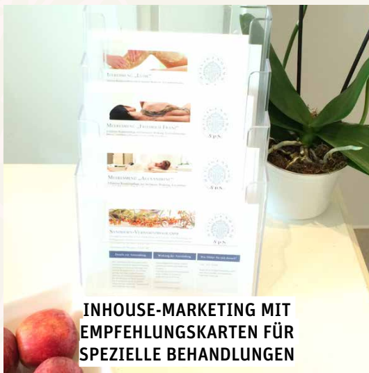
INHOUSE-MARKETING MIT EMPFEHLUNGSKARTEN FÜR SPEZIELLE BEHANDLUNGEN