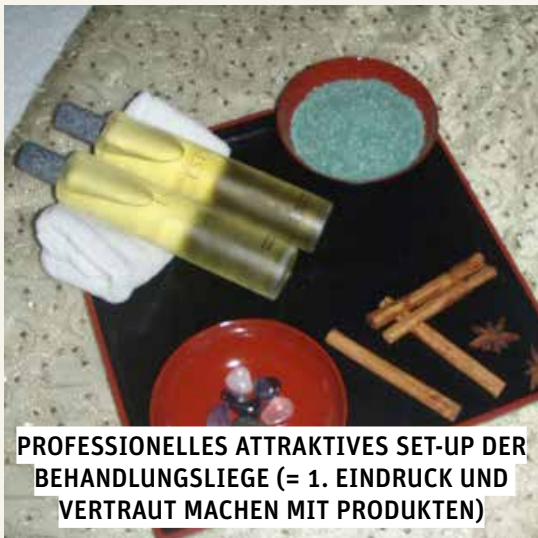
PROFESSIONELLES ATTRAKTIVES SET-UP DER BEHANDLUNGSLIEGE (= 1. EINDRUCK UND VERTRAUT MACHEN MIT PRODUKTEN)