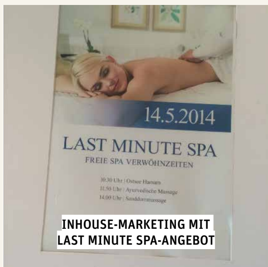
INHOUSE-MARKETING MIT LAST MINUTE SPA-ANGEBOT