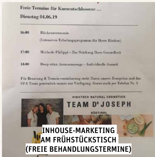
INHOUSE-MARKETING AM FRÜHSTÜCKSTISCH (FREIE BEHANDLUNGSTERMINE)