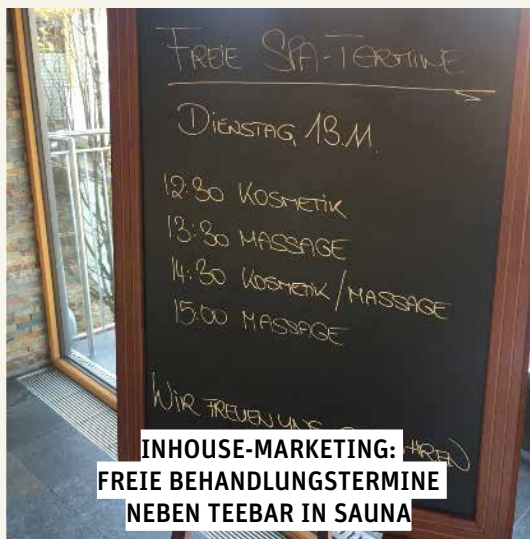
INHOUSE-MARKETING: FREIE BEHANDLUNGSTERMINE NEBEN TEEBAR IN SAUNA