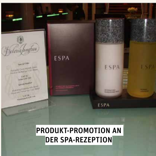
PRODUKT-PROMOTION AN DER SPA-REZEPTION