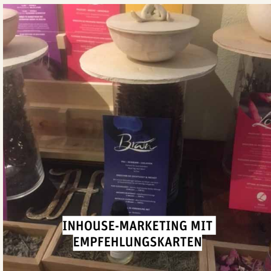
INHOUSE-MARKETING MIT EMPFEHLUNGSKARTEN