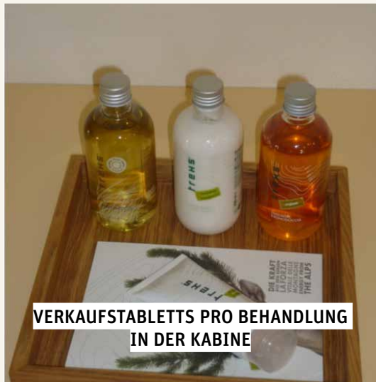
VERKAUFSTABLETTS PRO BEHANDLUNG IN DER KABINE