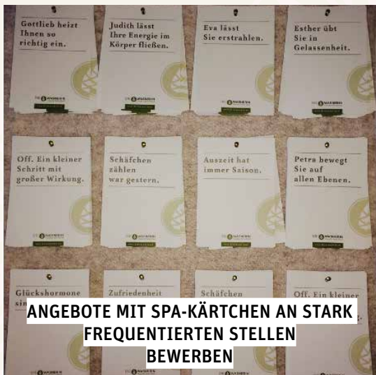
ANGEBOTE MIT SPA-KÄRTCHEN AN STARK FREQUENTIERTEN STELLEN BEWERBEN