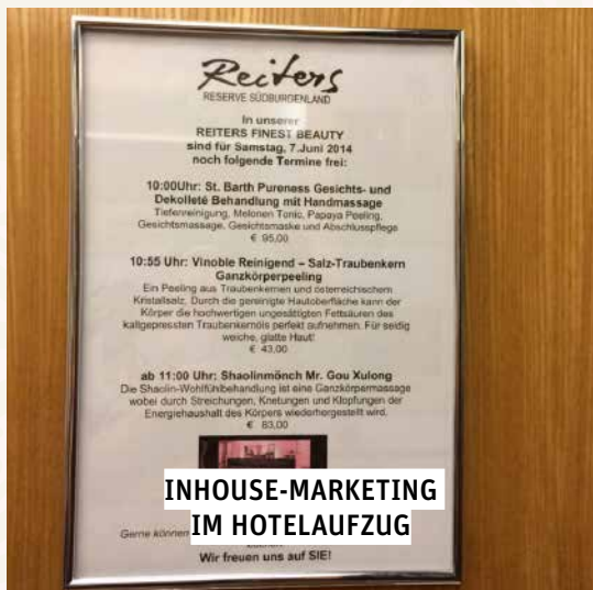
INHOUSE-MARKETING IM HOTELAUFGANG